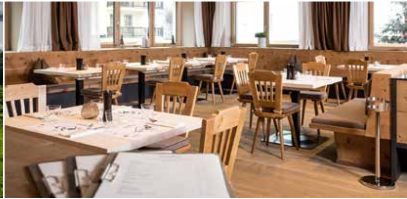
Sportressort Hohe Salve | Hopfgarten Arch. Geisler & Trimmel