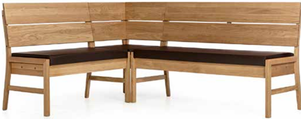
GAIS Eckbank Wildeiche | Kernbuche Lederbezug 1948 x 1548 x 890 cm 1200 x 480 x 405 cm