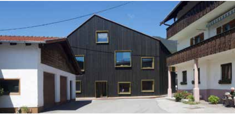
Fügenschuh-Hrdlovics Arch. DI Fügenschuh-Hrdlovics