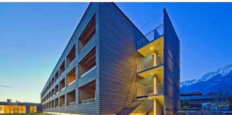
Hotel Reschenhof Mils Arch. DI Reinhard Madritsch | Madritsch-Pfurtscheller