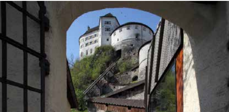
Festung Kufstein Arch. DI Gerhard Mitterberger