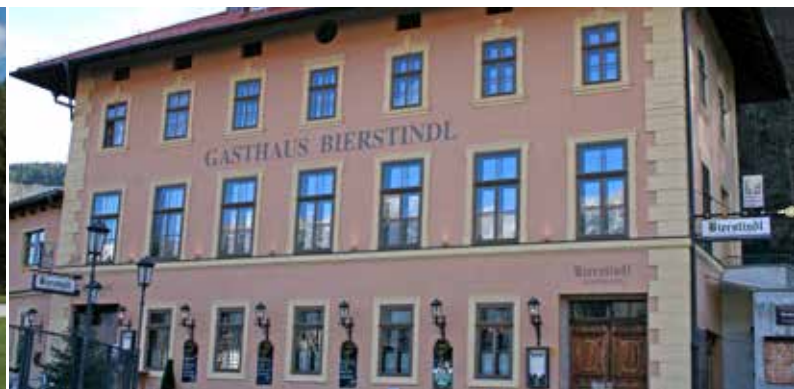
Gasthof Bierstindl | Augustiner Brauerei Arch. DI Jürgen Hörhager