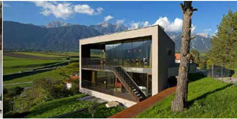
Haus M Arch. DI Fügenschuh-Hrdlovics