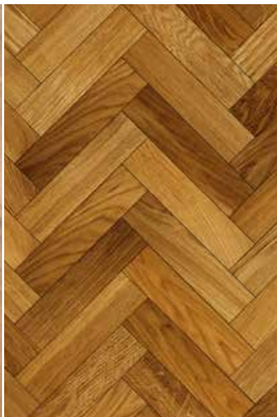
Stabparkett | Fischgrät