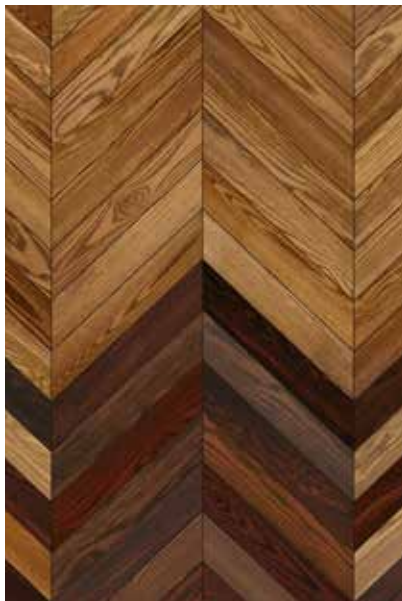
Stabparkett | Chevron