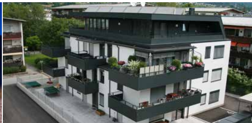
Kringsalm | Obertauern Arch. Geisler & Trimmel