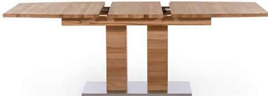
MOSO Wildeiche 1800 x 900 x 750 cm Mit synchronisierten Auszugsschienen der Tischplatte Sockel aus Edelstahl