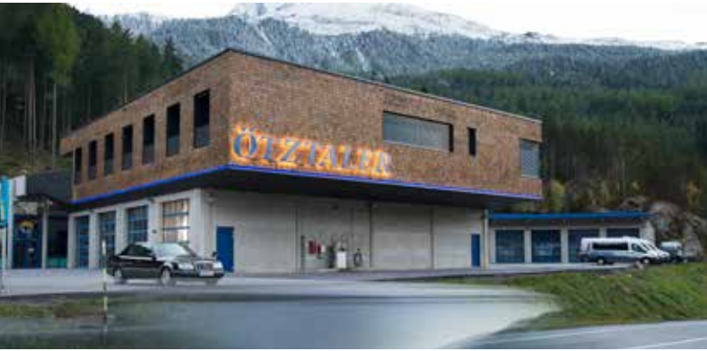
ÖVG | Öztaler Verkehrsbetriebe Arch. DI Stefan Schrott