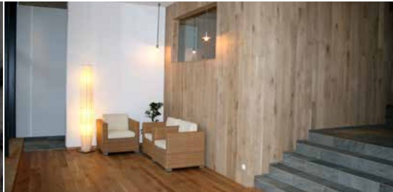
Schönblick | Obergurgl Arch. DI Christian Reich