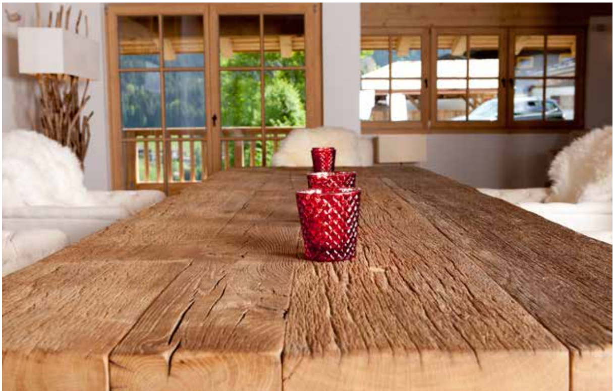
LENGMOOS Tisch Eiche Altholzbohlen