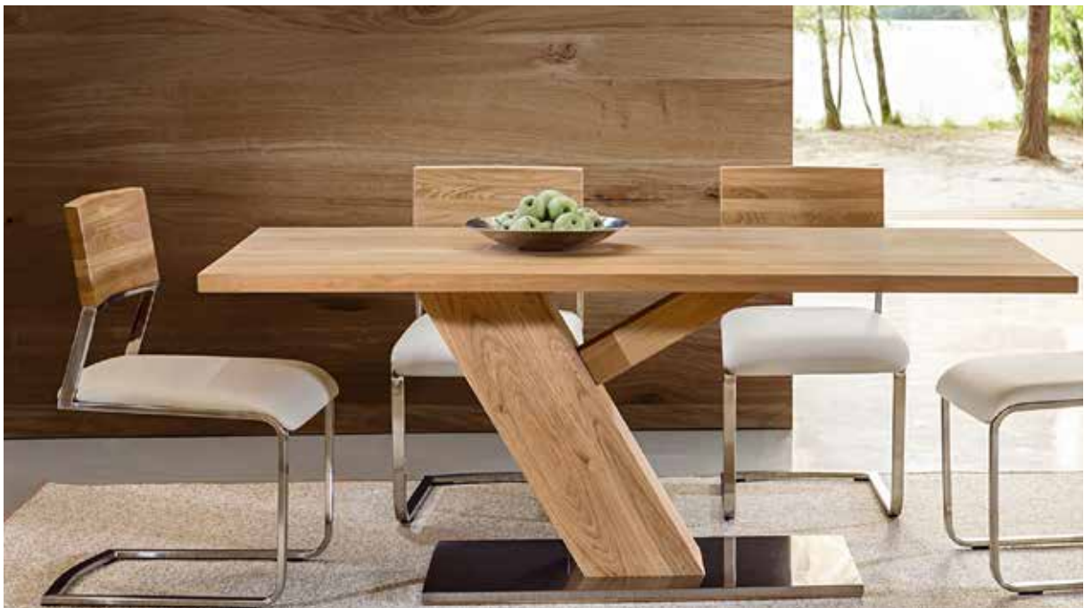
RANGGEN Wildecke massiv 1600/2050x900x750cm