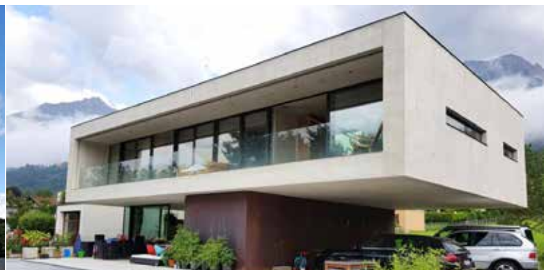
Haus A Arch. DI Peter Lorenz