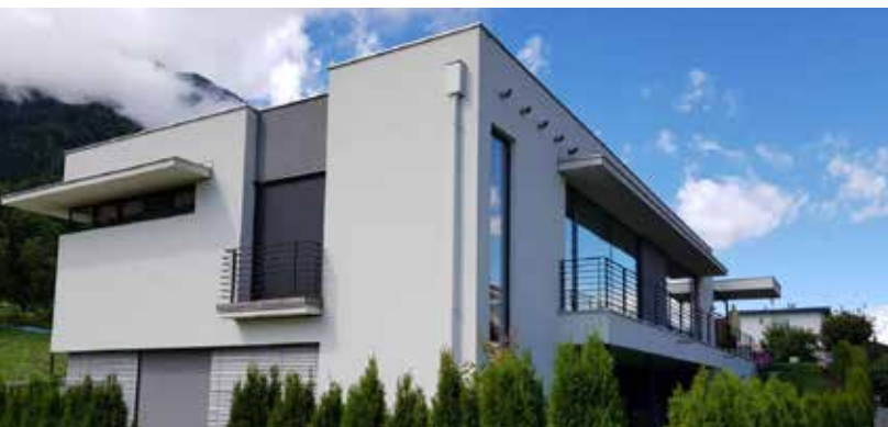
Haus R Arch. DI Melis & Melis