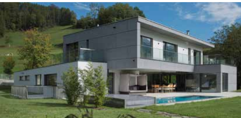
Villa M Arch. DI Peter Ramsauer