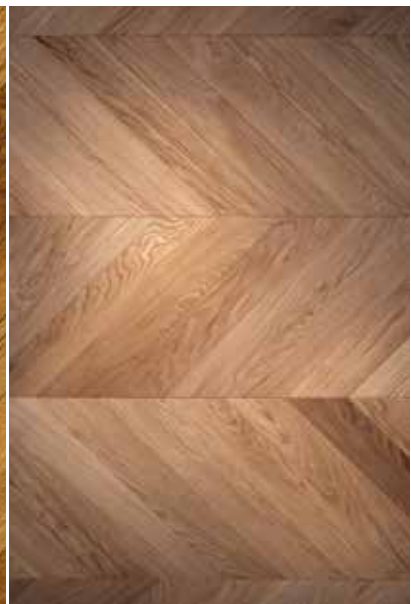
Stabparkett | Chevron